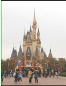
☆クリスマスムード色の園内☆

そして、帰りのバスではたくさんのお土産に囲まれて夢の中へ…。充実した一日を過ごせましたね。おつかれさまでした。