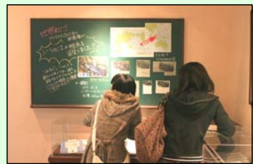
館内を隈なく観て回る参加者